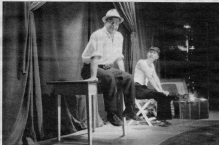
Une grande première avec l'implantation d'un chapiteau de cirque au bourg, les 7 et 8 mai.

Ces trois jeunes artistes ont trouvé le secret pour mêler burlesque et émotion, en racontant leurs voyages sous leur chapiteau itinérant. Ça vaut le coup de voir « Midi