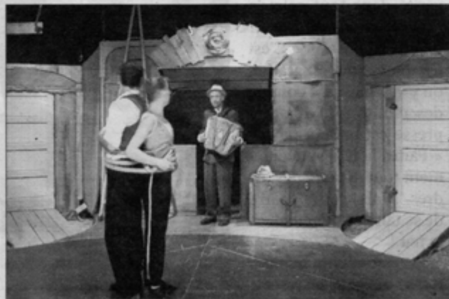
Histoires sans parole.

INFO tous les jours à 20 h 45 Bastion Bas entrée 2 €.